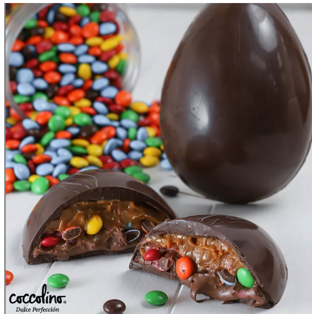
HUEVO M&M- NUTELLA- MANJAR