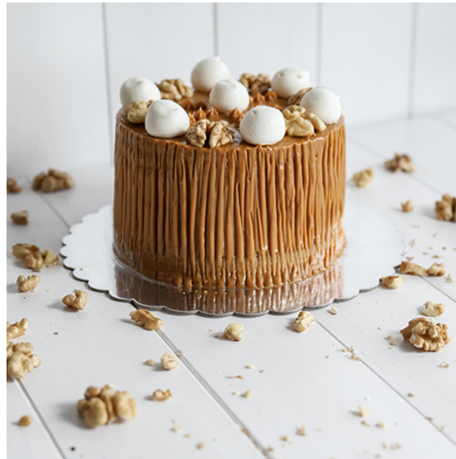
TORTA NUÉZ MANJAR