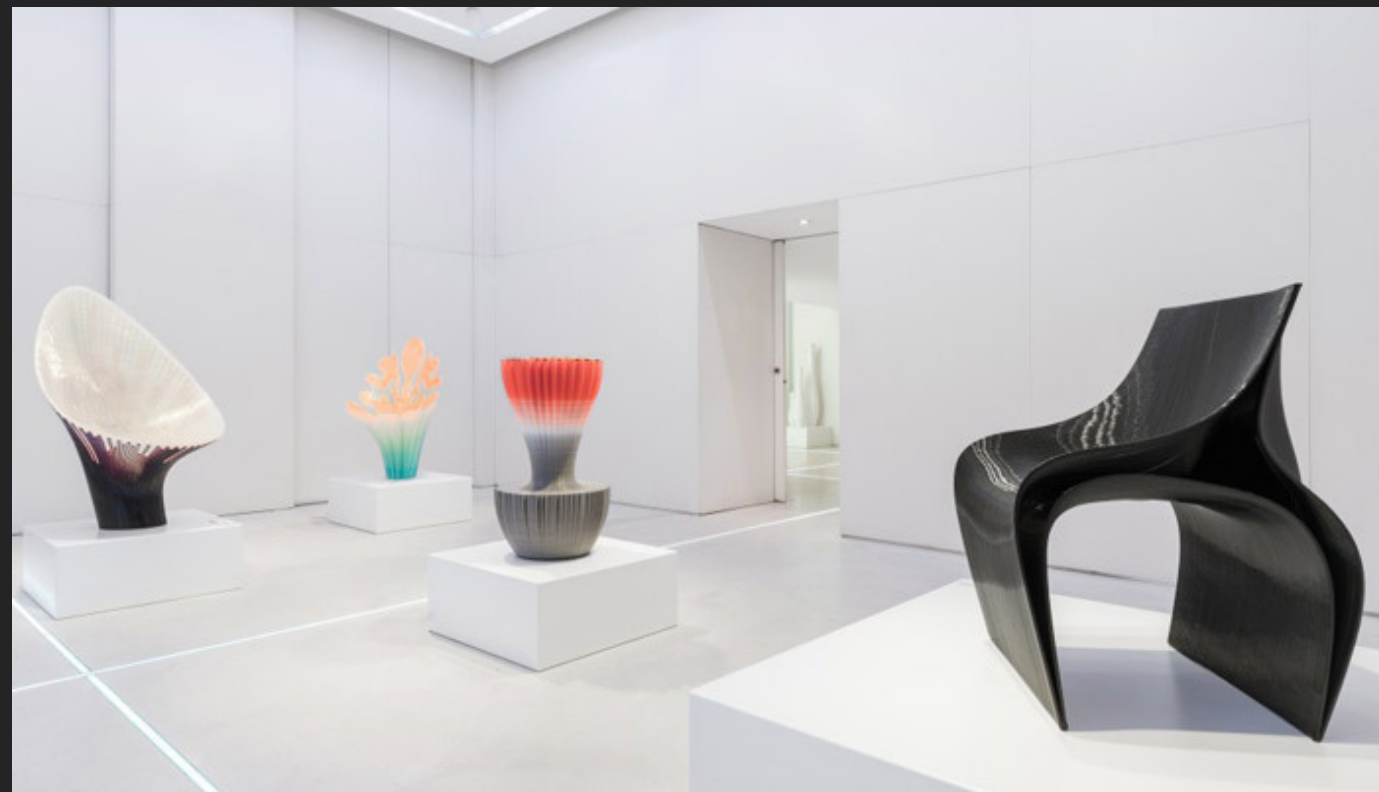
AUTOR: ESTUDIO NAGAMI Y ZAHA